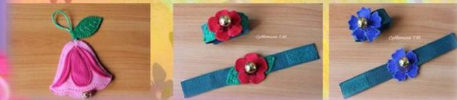
Браслеты «цветочки» - васильки, маки, ромашки