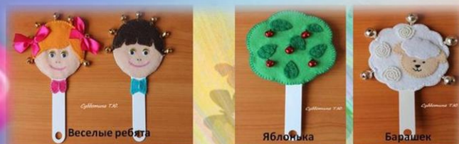
Колокольчик (на пальчик)

Шумовые музыкальные инструменты «Бубенцы»